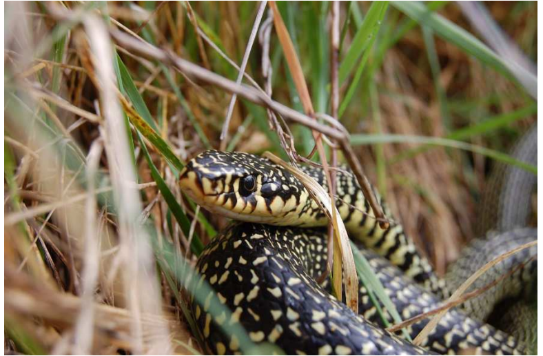
Couleuvre verte et jaune

Nous ne pouvons que vous conseiller tous ses livres sur le sujet qui la passionne depuis toujours. Ils sont cités ou présentés dans la dernière gazette, vous ne regretterez pas le voyage !