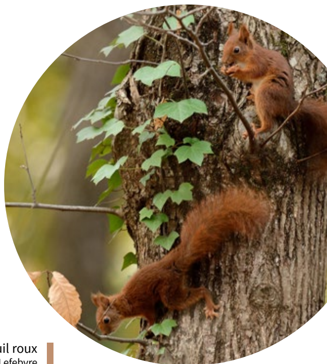
Écureuil roux

Chaque arbre est un monde en soi. Chacune de ses parties offre ombre, fraicheur ou chaleur à ses occupants.