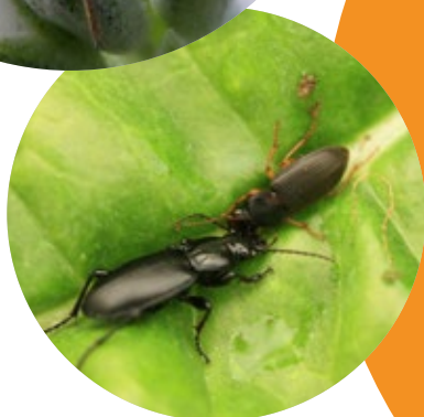
Pterostichus sp.

Afin de favoriser les insectes auxiliaires dans vos cultures, nous vous conseillons de vous référer à cet ouvrage très intéressant :