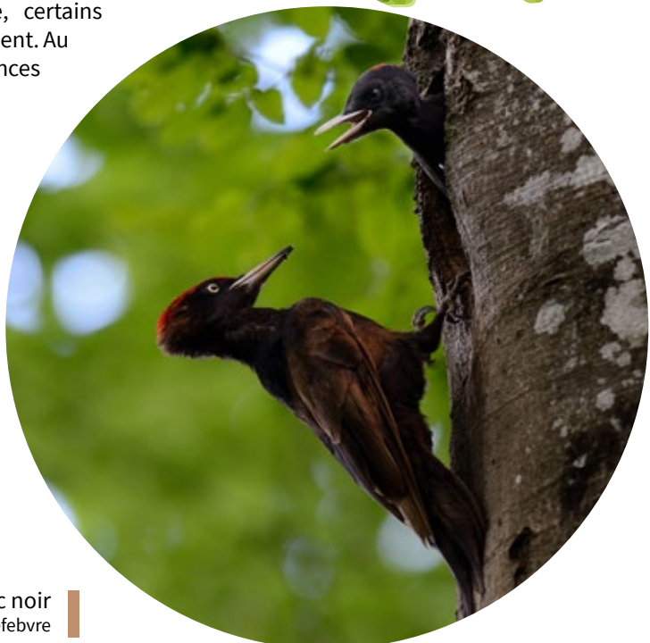
Pic noir

Lorsqu'il meurt, le bois d'un arbre s'amollit, ce qui déclenche l'assaut d'un nombre incalculable d'espèces saproxyliques, c'est-à-dire qui se nourrissent de bois mort. Les creux formés par ces attaques forment des logis pour des coléoptères, des chauves-souris, ou des rapaces nocturnes. Les arbres morts sont souvent considérés comme inutiles et abattus, pourtant un cinquième des espèces animales et végétales connues en dépendent.