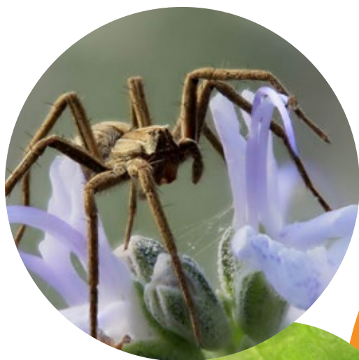
Pisaura mirabilis

La plupart des auxiliaires des cultures vivent dans la haie. Ils y trouvent un lieu d'hivernation, un abri ou un garde-manger pendant l'été. Planter une haie est sans doute la meilleure méthode de les maintenir au sein de la ferme.