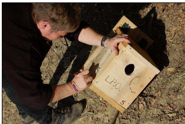
Marquage des nichoirs pour faciliter le suivi

Le partenariat avec la LPO se poursuit en 2018. Cette association via ses bénévoles nous fournit une vingtaine de nichoirs (mésanges, rouge-queue, faucon crécerelle et chauves-souris). Ils seront posés sur une ferme partenaire le samedi 1 er décembre.