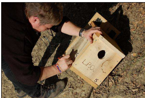
Marquage des nichoirs pour faciliter le suivi

Notre partenariat avec la LPO a été plus que fructueux en 2017. Cette association via ses bénévoles nous a fourni une quinzaine de nichoirs (mésanges, rouge-queue, huppe fasciée et chauves-souris). Ils ont été posés au cours du chantier VPN début novembre et feront l'objet d'un suivi régulier.