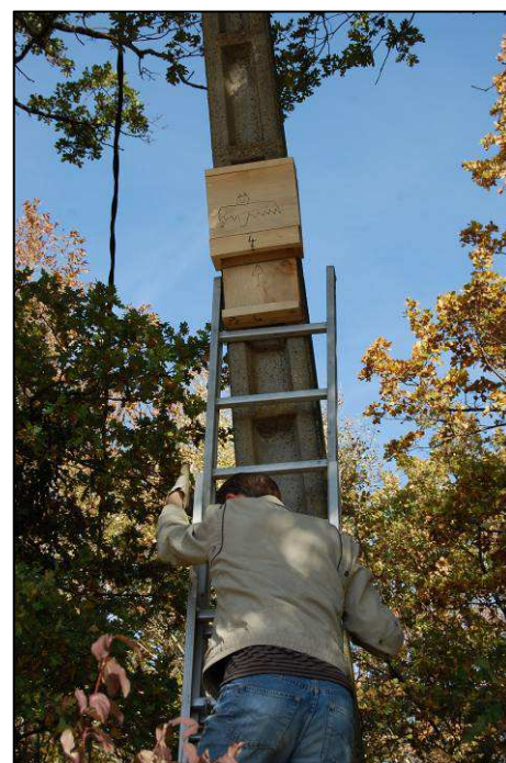
Pose d'un nichoir à chauves-souris

Nous allons continuer à approfondir les liens entre nos deux structures qui sont complémentaires.