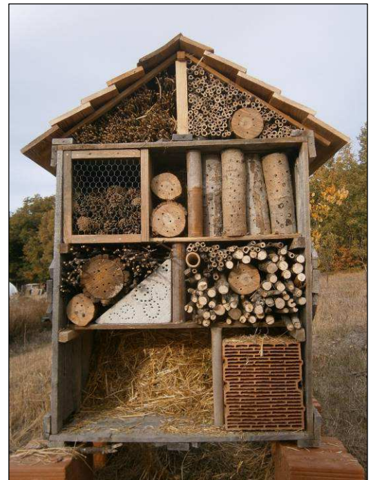
Hôtel à insectes réalisé pendant le chantier VPN

Il s'agit donc de créer une petite activité de fabrication de nichoirs qui seront posés, selon les besoins, sur les fermes ayant bénéficié d'un diagnostic biodiversité. Nous pouvons également envisager de fabriquer des hôtels à insectes. Il est envisageable de mettre en place des partenariats avec les structures existantes comme par exemple la LPO qui en fabrique déjà. Pour les matériaux nécessaires, nous pourrons nous appuyer sur la recyclerie locale.