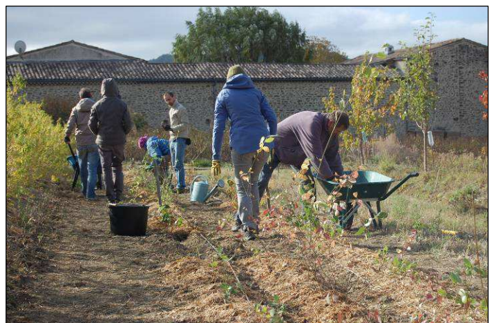
Mise en place de la pépinière de jeunes arbustes prélevés en forêt, novembre 2017. Chantier VPN.

A ce jour, nous comptons environ soixante adhérents, des particuliers mais aussi le CFPPA de Die (Centre de Formations Professionnels de l'Agriculture) ou encore l'APEG (association de protection de l'environnement de Grignan) et Actions Citoyennes Mirmandaises.